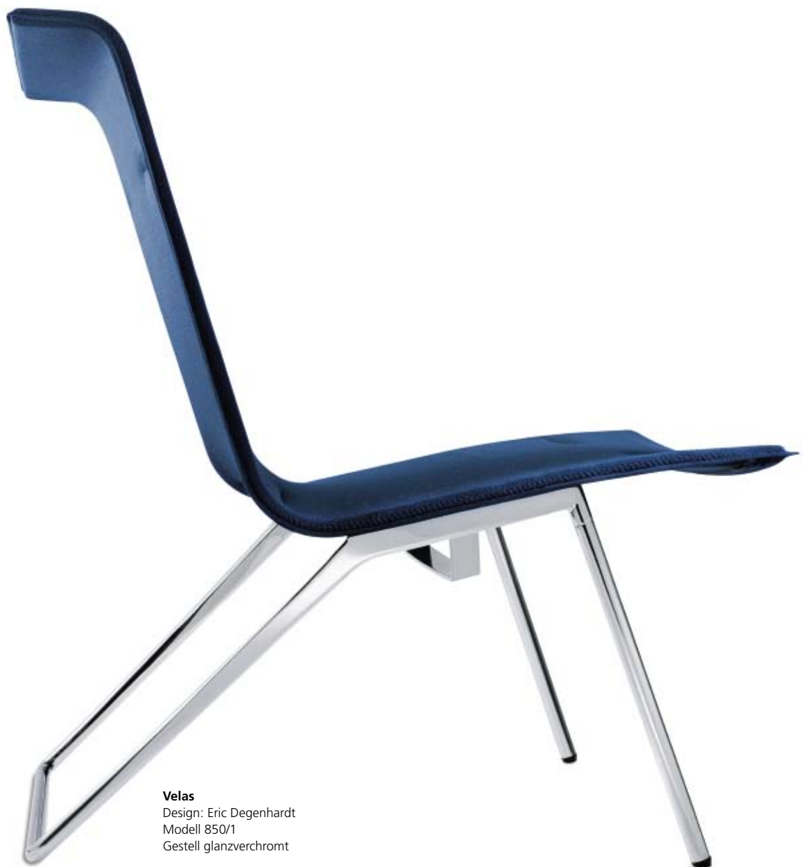
Velas Design: Eric Degenhardt Modell 850/1 Gestell glanzverchromt